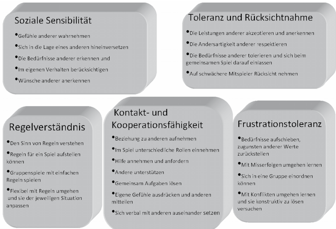
Abb. 2: Basiskompetenzen sozialen Handelns (Zimmer, 2011, S.36)

Spiele und Bewegungsaktivitäten bieten vielfältige Gelegenheiten, soziale Lernprozesse zu initiieren und zu gestalten. Zimmer (2011, S. 36) beschreibt fünf Basiskompetenzen sozialen Handelns, die bei Bewegungsaktivitäten in der Gruppe eine Rolle spielen bzw. aufgrund bestimmter Regeln und Spielgedanken in das Spiel integriert sind: Soziale Sensibilität, Toleranz und Rücksichtnahme, Kontakt- und Kooperationsfähigkeit, Frustrationstoleranz und Regelverständnis. Die folgende Abbildung verdeutlicht, wie sich diese Basiskompetenzen sozialen Handelns in Bewegungsspielen wiederfinden.