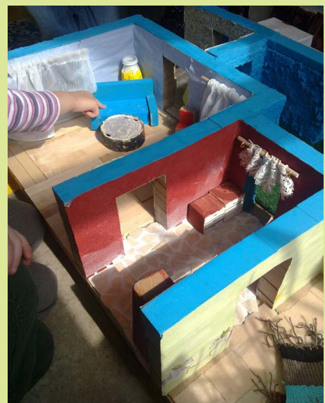
Abb. 3: Hausbau (Lichtblau)

Eines Morgens berichtete ein Junge im Morgenkreis der Kitagruppe von einer neuen Baustelle direkt gegenüber seines Wohnhauses. Diese faszinierte ihn sehr und auch die anderen Kinder der Gruppe fanden das Thema spannend. Die Bezugserzieherin des Kindes beschloss daraufhin, mit allen Kindern gemeinsam diese nicht weit entfernte Baustelle am Nachmittag zu besuchen. An der Baustelle angekommen hatte die Gruppe Glück, denn der Architekt war gerade vor Ort, freute sich über den »